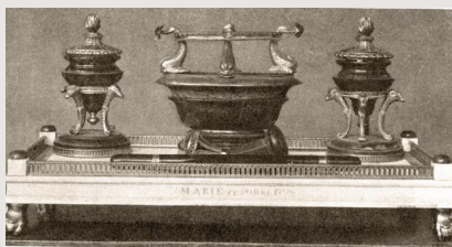
Стол в кабинете великой княгини Марии Федоровны в Большом Павловском дворце. Т. 2. После с. 472

кает к себе внимание использованием многочисленных исторических источников и литературы. Бесценным является подробное описание отдельных архитектурных деталей и интерьеров, а также иллюстративный материал —